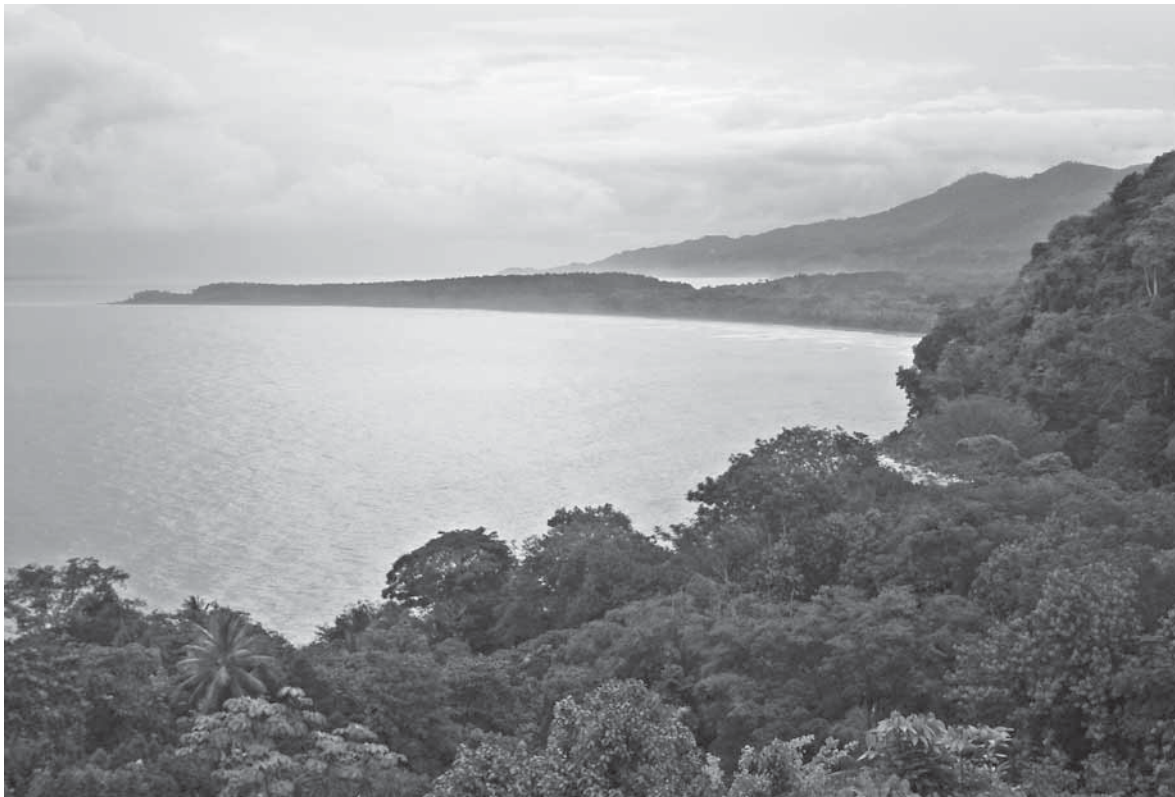
Punta Uvita, Costa Rica