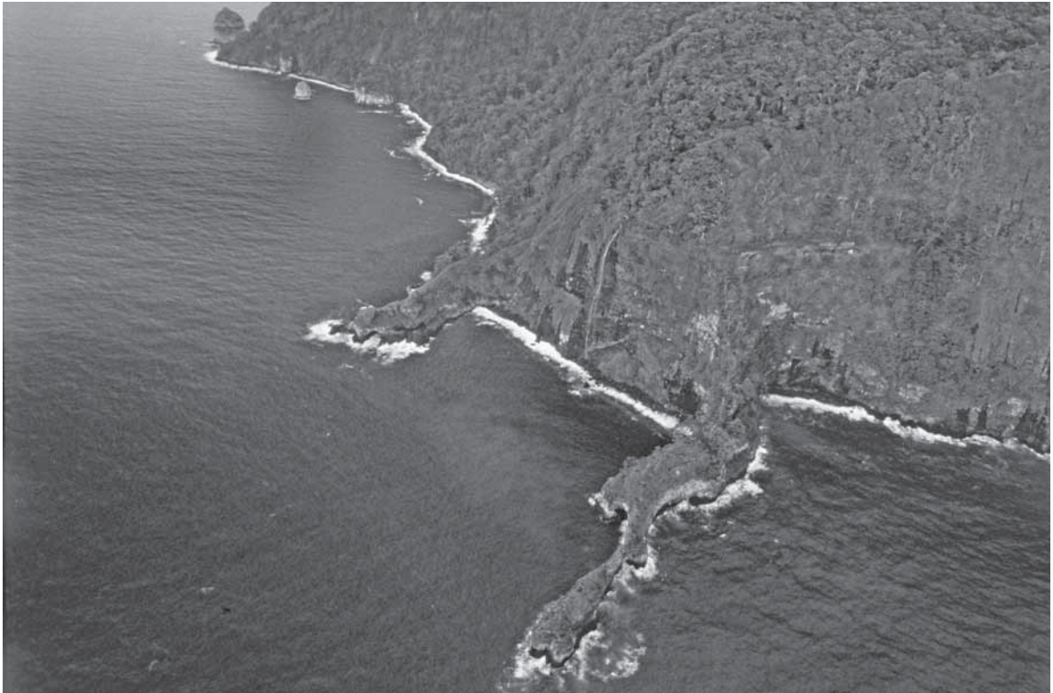
Isla del Coco, Costa Rica