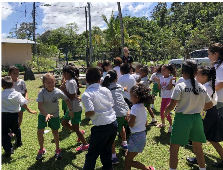
Figura 1. Juego inicial de apertura y confianza entre participantes “traigo carta para...”