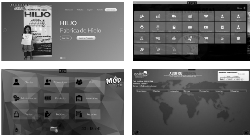
Figura 2. Elaboración de Software para el Proyecto de Extensión

En este apartado se presenta de forma general cada uno de los software desarrollados para cada una de las organizaciones involucradas en este proyecto de extensión.