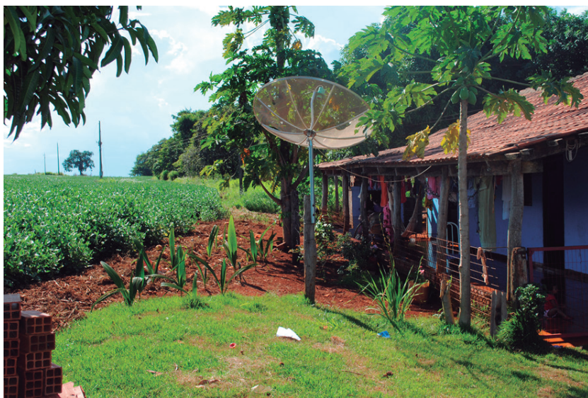
Figura 2: Proximidade das lavouras das residências

E o que é mais grave, é que as residências e os cultivos de frutas, na maioria dos lotes, ficam a poucos metros de distância das lavouras, expostos, assim, aos agrotóxicos. A Figura 2 apresenta a proximidade das lavouras das residências.