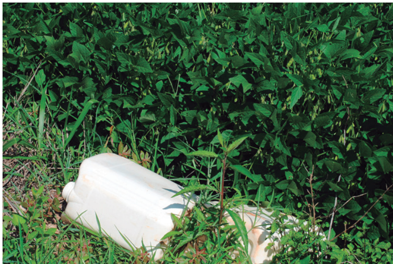
Figura 3: Descuido com as embalagens vazias de agrotóxicos