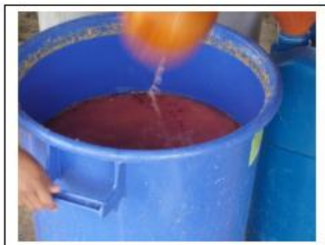
Figuras 9.

O turismo com as características acima pode ser sustentável para a comunidade na medida em que esta conheça os impactos positivos e negativos da atividade, participe do planejamento e tome decisões quanto a sua implantação. Além disso, saiba definir quais aspectos da modalidade pretende explorar. Outro fator que a comunidade deve compreender é que o turismo de base local tem como foco a melhoria da qualidade de vida dos residentes nos seguintes aspectos: manutenção da cultura local, produção agrícola, culinária, pintura, mitos e ritos, tudo isso associado às vantagens econômicas, de acessibilidade e outros serviços que o desenvolvimento do turismo proporciona.