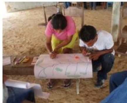
Figuras 3 e 4.