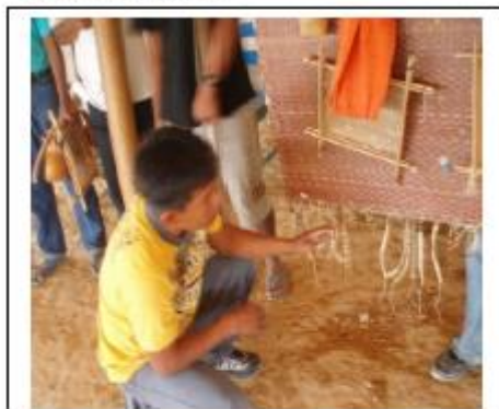
Figura 7.