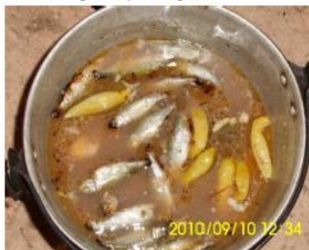
Figuras 5 e 6.