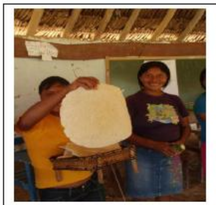
Figuras 8.