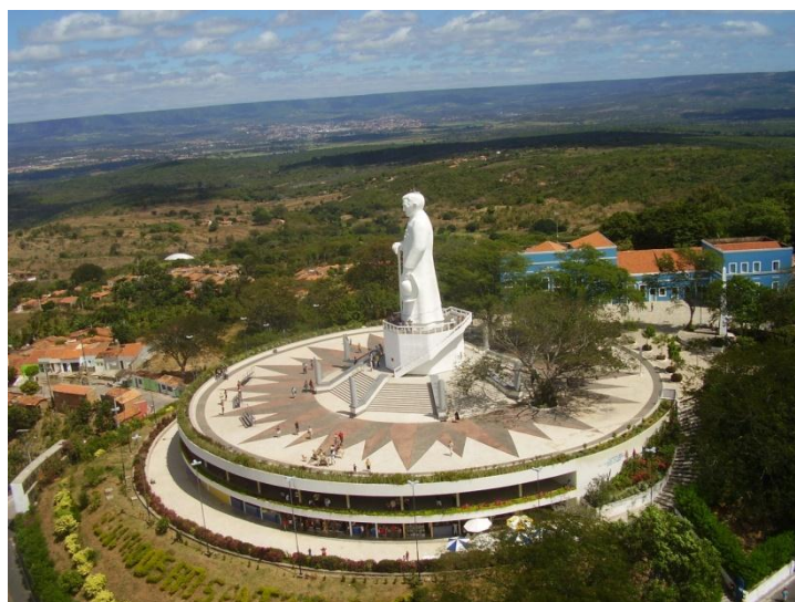
Figura 02: Monumento do Padre Cícero na Serra do Horto.

A percepção da representação da imagem ou do mito religioso Padre Cícero é reforçada pelas territorialidades em diferentes escalas. Ao visualizar a figura 02, o monumento turístico-religioso do Padre Cícero no serrote do Horto em Juazeiro do Norte – Ceará constata-se pequenos “monumentos” nos estados aqui enfocados, em lugares de destaque da cidade: praças públicas, hospitais, estabelecimentos comerciais e educacionais e outros, simbolizando a fé e os territórios de sustentação dessa devoção além das fronteiras de Juazeiro do Norte-Ceará.