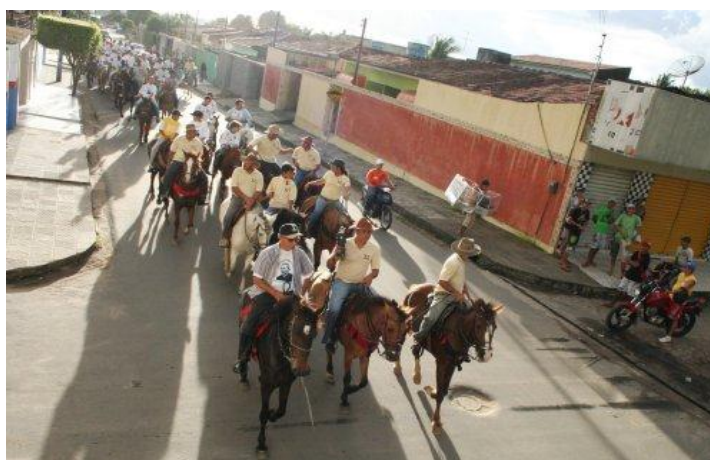
Figura 03: Cavalgada do Padre Cícero.

Observa-se que os lugares que demandam Juazeiro vêm constituindo novos pólos de romarias, novos eventos e que vem desenvolvendo estratégias de marketing e repercussão para estabelecer as bases do turismo religioso receptivo e emissivo a partir da fé no “padim”. Mas, até onde Juazeiro do Norte como pólo emissivo desse turismo se sustentará espiritualmente e economicamente? Nesse sentido, constata-se que o número de eventos que giram em torno da devoção ao Padre Cícero vem crescendo e irradiando, nos diversos territórios dos estados da Paraíba, Pernambuco e Alagoas. A Cavalgada do Padre Cícero em Arapiraca cidade do estado de Alagoas, demonstra bem os diversos eventos em torno dele. Em 28 de julho de 2008, aconteceu a II Cavalgada em homenagem ao Padre (fig.03). Denota-se além da fé, o esporte, o lazer e porque não fortalecer os laços de amizades.