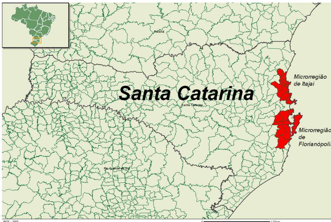
Figura 1: Localização das microrregiões de Itajaí e de Florianópolis no estado de Santa Catarina.

O estado de Santa Catarina é dividido geograficamente em 20 microrregiões, dentre as quais as microrregiões de Itajaí e de Florianópolis, enfocadas no presente estudo, cuja localização pode ser observada na figura 1.