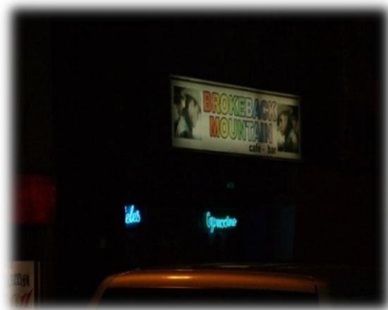
Imagen 4. Bareback Mountain.

Uno de los sitios de encuentro más conocidos es Brokeback Mountain , este café bar, ofrece muchas alternativas para las parejas y los grupos de amigos, en un espacio propicio para el espectáculo donde se ofrecen servicios como karaoke, uno de los planes un poco más “calmados” dentro del ambiente de rumba que se vive en los establecimientos aledaños.