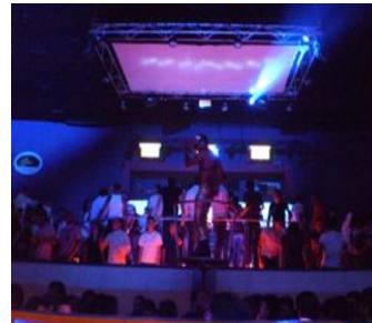
Imagen 1. Theatron de Pelicula.