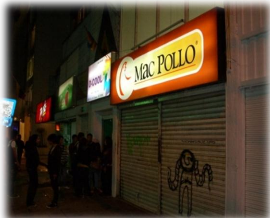
Imagen 2. Comparsa de Theatron, marcha del orgullo gay del 2009. (Imágen de archivo personal, Junio 2009).

D-Cool Bar , ubicado en la calle 59 justo en la parte de atrás de Theatron, se caracteriza por ser uno de los bares que más población LGBT frecuenta, pero de una característica significativa, en un 85% son miembros de la comunidad entre los 17 años hasta los 19 años.