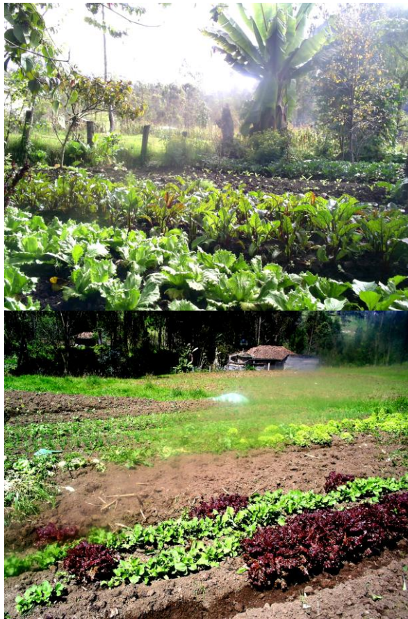
Lechugas, zanahorias, cebollas. una gran parte de la producción se consume diariamente.

Sin embargo, el tiempo dedicado a la producción de hortalizas (hasta cinco horas diarias para un huerto de 400m 2 ) es importante, sin considerar las tareas con los animales (ordeño de las vacas, corta de hierba, etc.). Por eso, las explotaciones de la parroquia Octavio Cordero Palacios se han orientado progresivamente a diversas producciones frutales, siguiendo la misma lógica de valorización de la tierra. Así, en la mayoría de las fincas se pueden encontrar plantas de tomate de árbol, de mora y de babaco. Estos cultivos anuales, igual que las hortalizas, favorecen la seguridad alimentaria campesina y permiten sacar ingresos regulares porque se venden muy bien en los mercados urbanos.