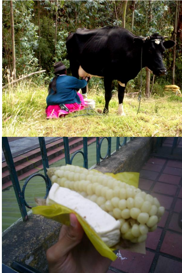
Ordeñar cada día, para vender la leche o comer quesillos.

Así, la importancia de la ganadería es innegable pero no se debe olvidar tampoco las crías de animales menores, como los cuyes o los aves, que siguen siendo muy consumidos, y no solamente durante los días de fiesta. Las explotaciones poseen por lo general entre 50 o 60 cuyes (a veces más) y hasta 40 pollos, lo que les permiten comer carne y vender regularmente algunos animales para aumentar sus ingresos. Eso favorece también las compras domésticas, lo que nos permite decir que la orientación pecuaria de las explotaciones puede favorecer la seguridad alimentaria de los campesinos en el contexto migratorio.