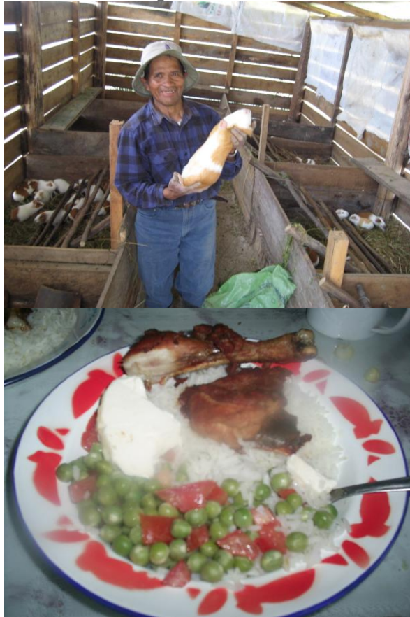
Cuyes y pollos se encuentran frecuentemente en la alimentación de los campesinos de la parroquia Octavio Cordero Palacios.

No obstante, no debemos perder de vista que el desarrollo de la actividad pecuaria es solamente uno de los cambios agrarios locales en el contexto migratorio. La multiplicación de los huertos ilustra también una mutación de las prácticas campesinas y una nueva forma de producción agrícola para llegar a la seguridad alimentaria familiar.