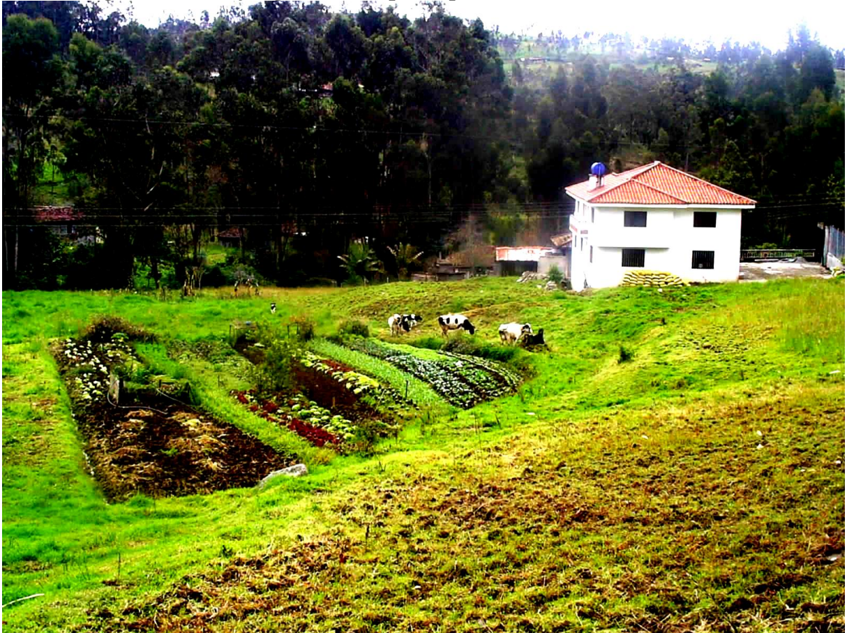
El tríptico del paisaje agrario en la parroquia Octavio Cordero Palacios: el huerto, el ganado y el símbolo del éxito migratorio, la casa nueva.

Este trabajo, a nivel de cada hogar, nos permitió precisar los efectos de la migración sobre las estructuras familiares campesinas, sobrepasando las estadísticas oficiales del INEC. Así, nos enteramos de que desde 1976, el 47% de la población había salido del país mientras que 26 individuos siguen trabajando en la ciudad de Cuenca en otros sectores de empleo, como obreros o empleados, provocando entonces una caída considerable de la mano de obra disponible. Lógicamente, se produjo una recomposición del trabajo agrícola y por eso, nos interesamos principalmente a las familias con migrantes para entender como ellas siguen trabajando la tierra para producir su comida.