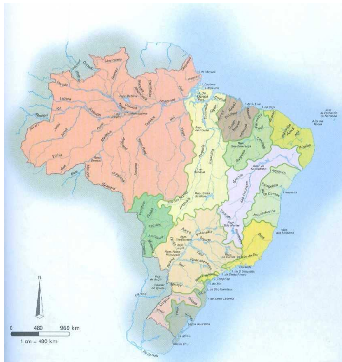
Fonte: Geografia (livro didático). João Carlos Moreira e Eustáquio de Sene. São Paulo: Scipione, 2005

O mapa a seguir, presente num livro didático de geografia, ensaia esta quebra de referente nos limites político-administrativos: os rios já atravessam as fronteiras, ainda que as bacias hidrográficas (aquilo que é o tema do mapa) não o façam, uma vez que se subordinam às fronteiras impostas pelo traçado que o Estado Brasileiro faz sobre o território (e que é seguido e referendado pelas escolas e políticas curriculares).