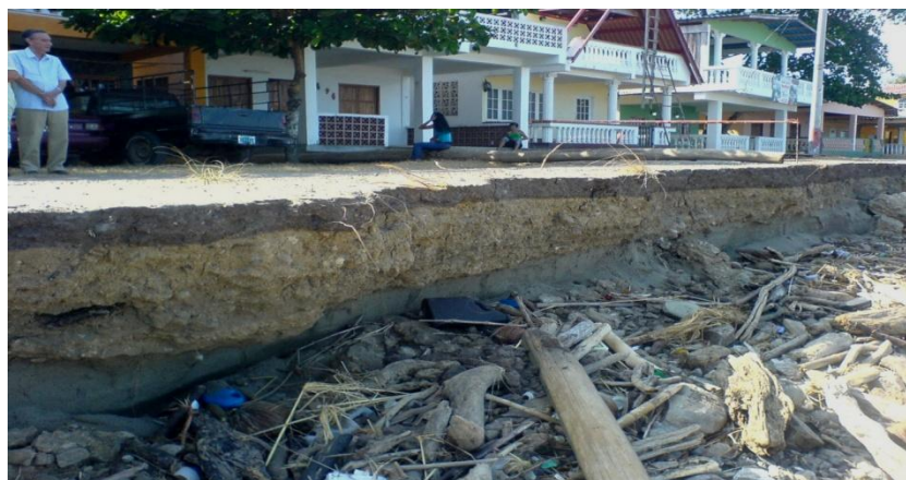
Foto 0. Vista complementaria. Playa La Concepción. Avance del oleaje sobre el Supralitoral. Febrero 2010.

El avance y comportamiento de la ola sobre la zona de rompiente, tiene episodios muy bien definidos: Al romperse la ola y liberar energía, provoca una turbulencia sobre el agua, a la cual se le denomina arrastre ; la batida es el desplazamiento del agua generado después de la zona de rompiente, el cual avanza sobre la pendiente del litoral o playa; finalmente, se señala como resaca , al fenómeno que ilustra el proceso de retroceso de la ola, cuando ésta ha perdido toda su energía sobre la pendiente litoral y retorna al área de rompiente.