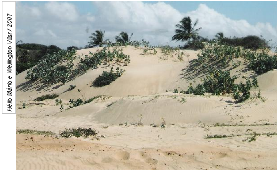
Figura 01 - Dunas móveis semi-fixadas parcialmente por vegetação (praia do Jatobá – município de Barra dos Coqueiros/SE).

Hélio Mário de Araújo Heleno dos Santos Macedo Givaldo Santos Bezerra Genésio José dos Santos