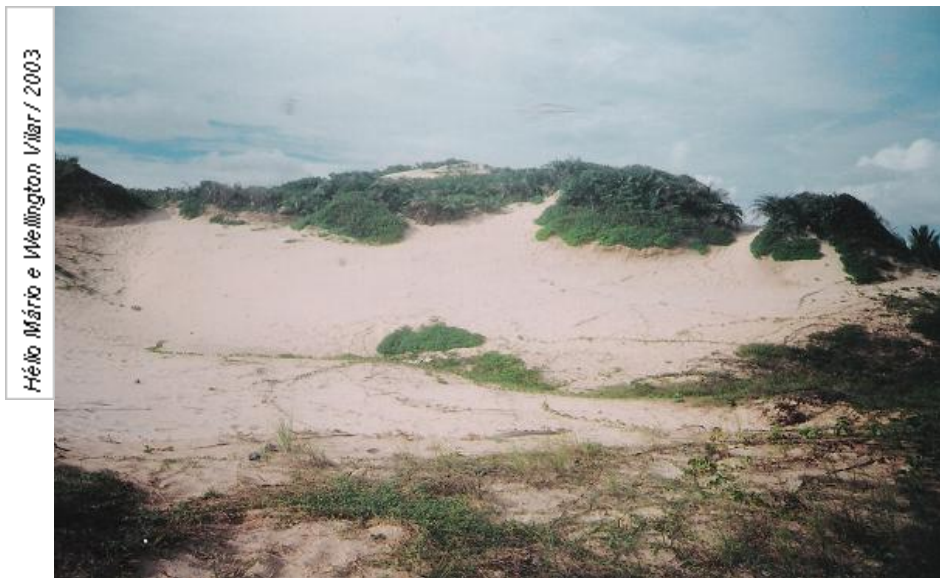
Figura 03 – Dunas móveis semi-fixadas parcialmente por vegetação de pequeno porte (praia de Aruana – Aracaju/SE).

dunas constitui-se no elemento da paisagem que mais chama a atenção na orla marítima e sua ocupação tem sido objeto de conflito de opiniões nos órgãos ambientais de licenciamento.