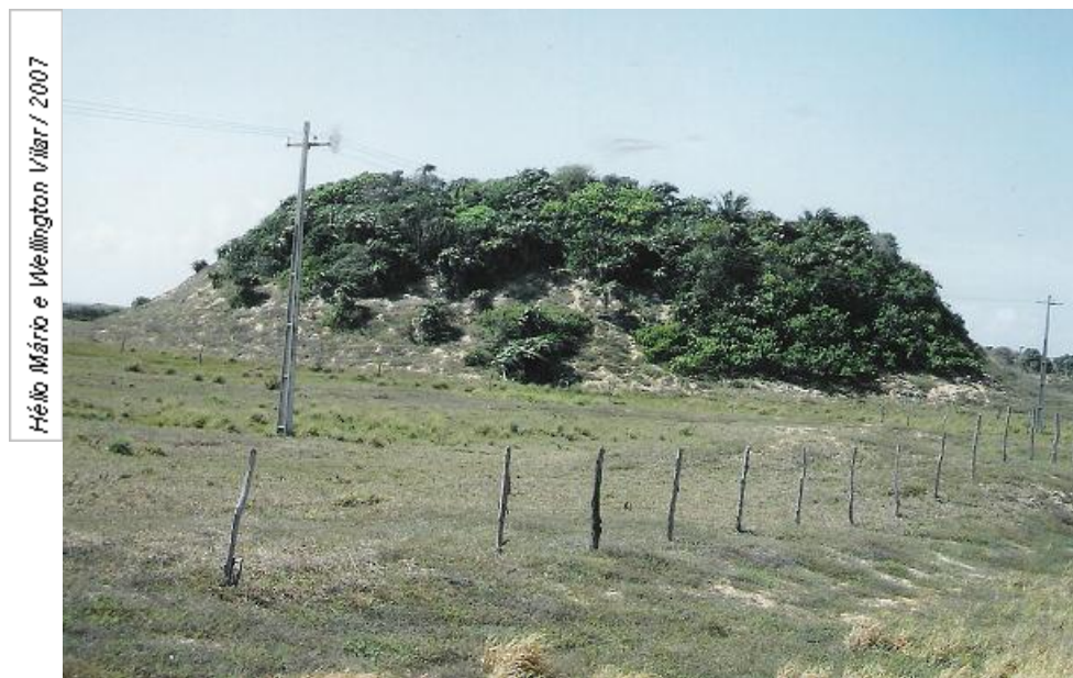
Figura 02 - Duna Fixa totalmente vegetada com aspecto morfológico de morro (praia do Porto no município de Barra dos Coqueiros/SE).

Os campos dunares do município de Aracaju, tiveram especial atenção atribuída por Melo e Souza et al. (2006) quando analisaram o processo de vulnerabilidade biofísica, através da proposição de geoindicadores socioambientais aplicando listas de controle de campo (field checks lists) a fim de se verificar a dinâmica costeira e dos fatores antrópicos intervenientes