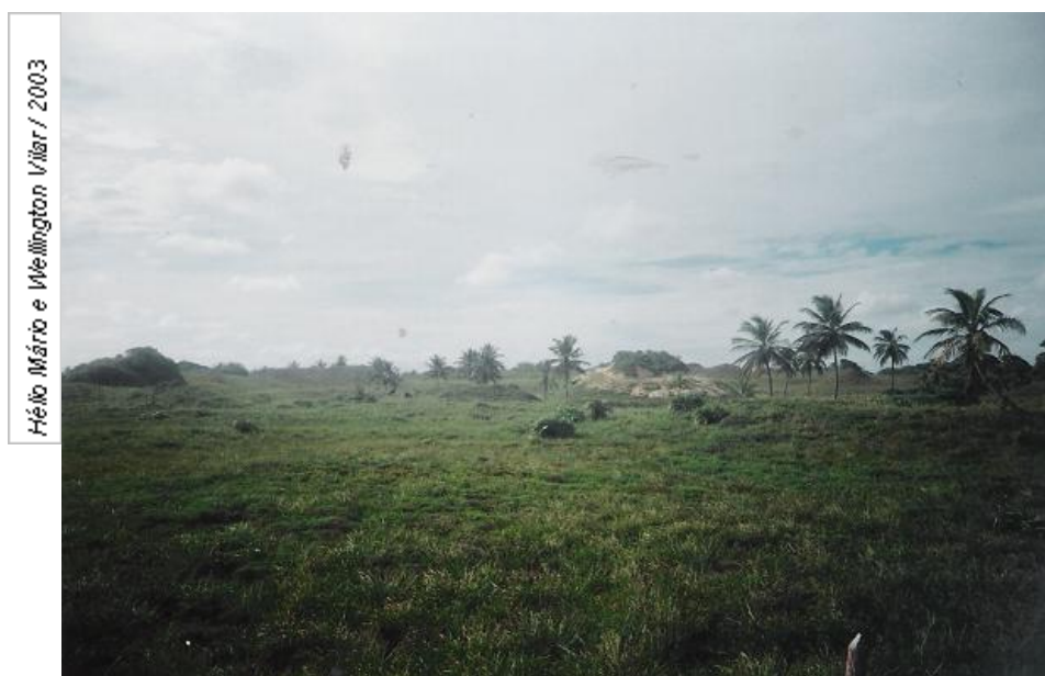
Figura 04 - Dunas fixas do conjunto dunar (trecho praia de Aruana – Rodovia dos Naufragos) em Aracaju/SE.

Baseando-se na carta topográfica Planialtimétrica, que compõe o mapa Geoambiental (Prefeitura Municipal de Aracaju, 2005), os autores demonstram que a faixa de terrenos onde se assentam as dunas da fachada atlântica, situada entre a Rodovia José Sarney e a Rodovia