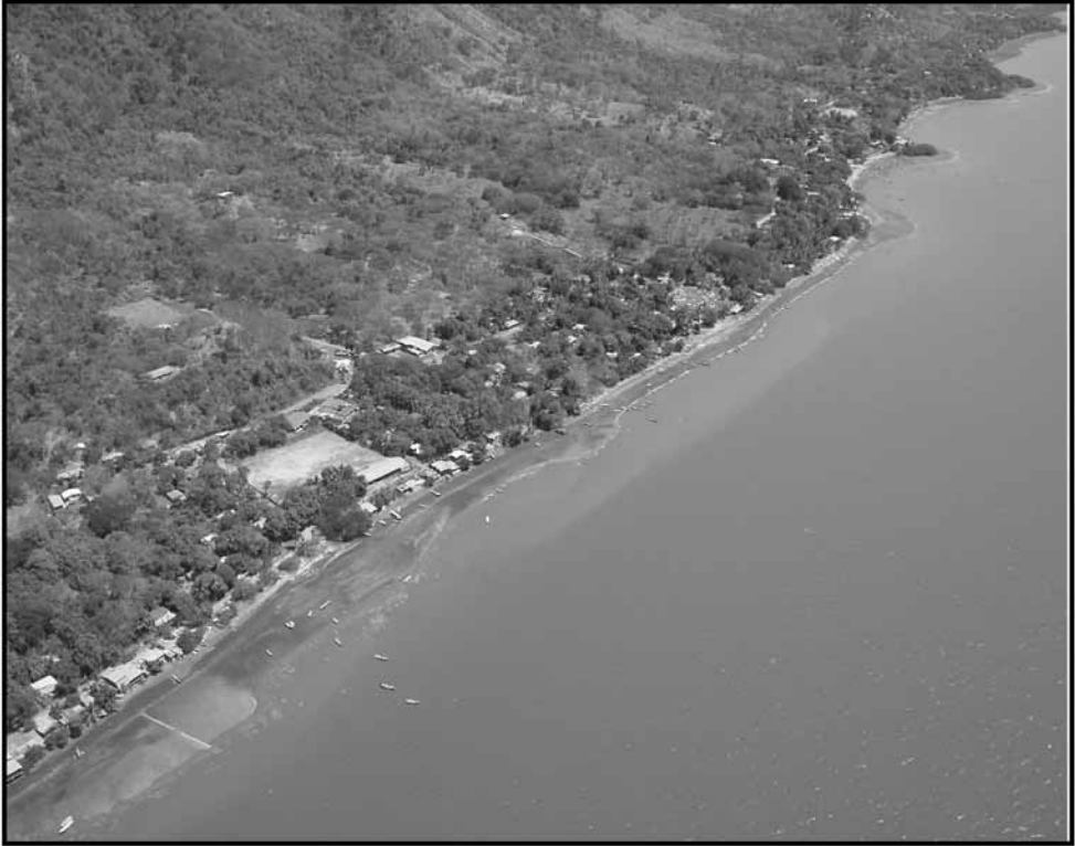
Figura 1: Toma aérea de la comunidad de Costa de Pájaros