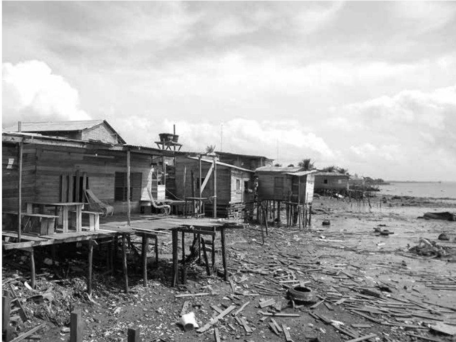
Figura 3: Casas as margens do Amazonas