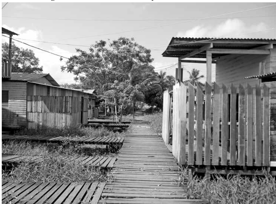
Figura 4: Casas de famílias que se mantem no local

Os moradores que vivem nas áreas de ressaca também habitam casas de madeira, usam passarelas de madeira para se locomoverem (Figura 4), sendo estas, em sua maioria deteriorada, dificultando o deslocamento da população residente no local, em especial de pessoas com maiores dificuldades de locomoção, a exemplo de idosos e deficientes físicos.