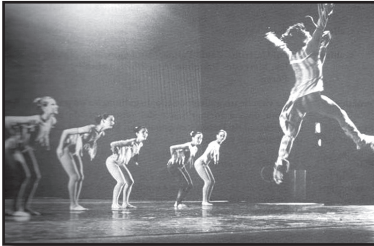
Fotografía 3.