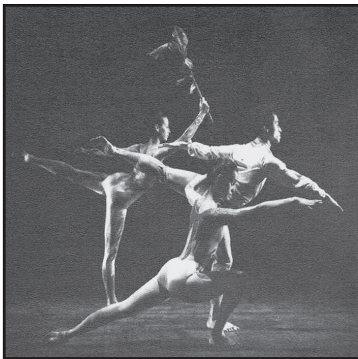
Fotografía 1: Propiedad de Elena Gutiérrez