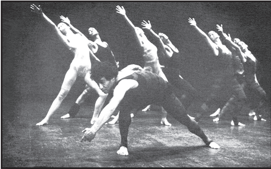
Fotografía 4.