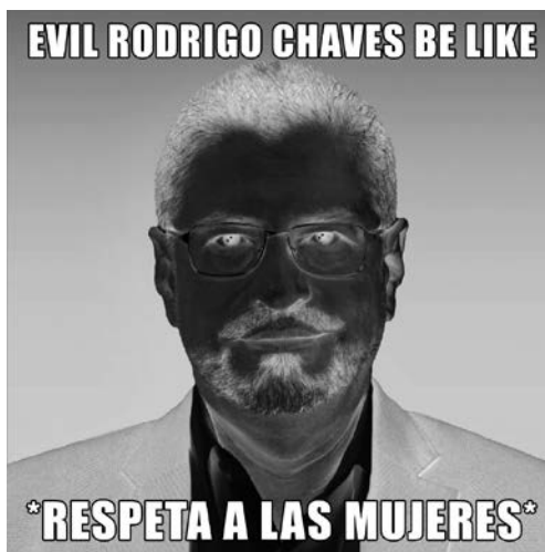
Figura 9. Relación de explicación 45

La explicación se da cuando uno de los modos agrega una descripción o aclaración del otro, esta relación se presentó en cuarenta y siete ocasiones. En la figura 9 se ejemplifica esta relación.