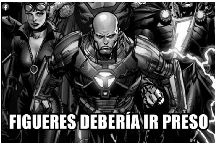
Figura 6. Asociación