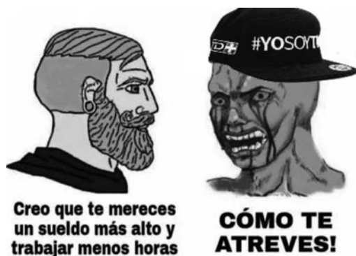
Figura 8. Relación de proyección

Nota: Captura de pantalla tomada del corpus.