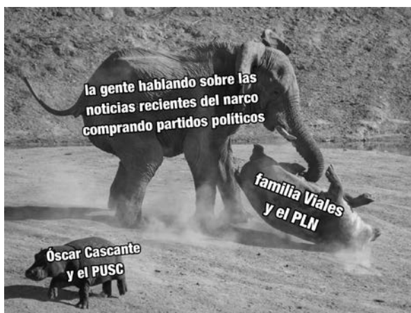
Figura 14. Estructura de etiquetado

Nota: Captura de pantalla tomada del corpus.