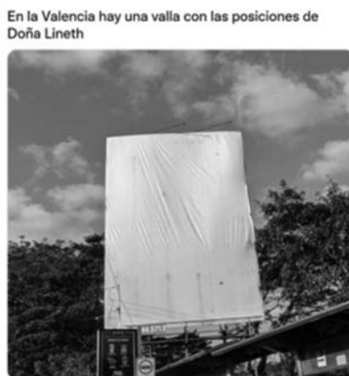
Figura 5. Ejemplo

En la figura 5, se observa que la relación entre imagen-palabras es de ejemplificación, ya que se supone que en la Valla van a aparecer las posiciones Lineth Saborío, candidata del Partido Unidad Social Cristiana, quien durante la campaña no mostraba una línea ideológica en casi ningún tema. Este meme, al poner la valla en blanco da a entender que la candidata no tiene posiciones.