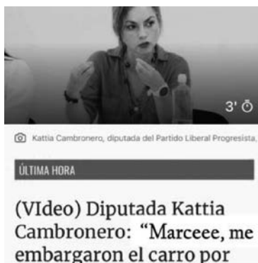
Figura 11. Estructura periodística

Nota: Captura de pantalla tomada del corpus.