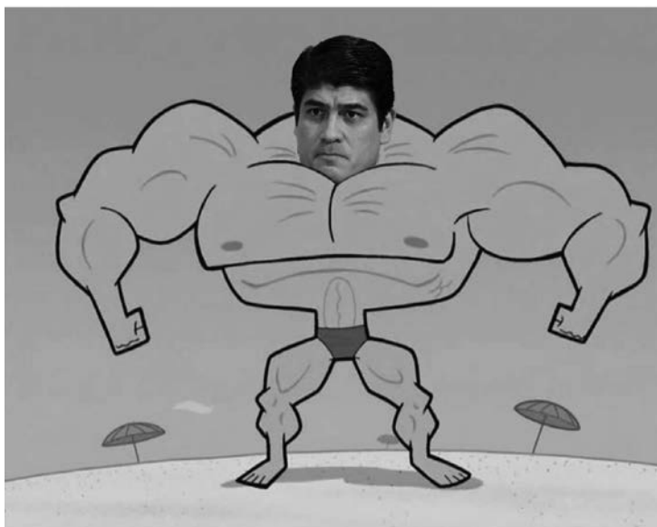
Figura 2. Meme intervenido

Nota: Captura de pantalla a partir del corpus de memes.