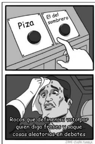
Figura 10. Estructura de comic

La estructura periodística se da cuando el meme imita la forma de una nota periodística, por ejemplo, la presente en la figura 11.