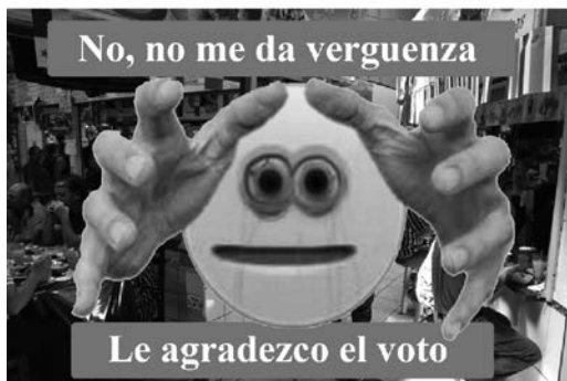
Figura 4. Acontecimiento

POV: Estás tranqui comiéndote un ceviche en el Mercado Central