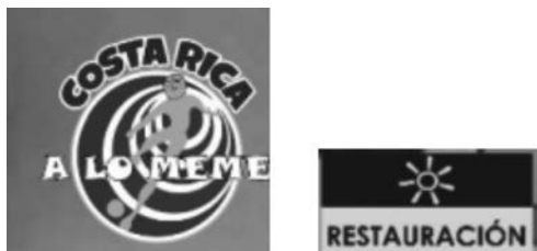
Figura 1. Extracción de dos íconos del meme 10 del corpus

Inicialmente, se revisaron los elementos de la capa básica (íconos, imágenes) y de la capa de plantilla (títulos, gráficos, mapas). En cuanto a los íconos, se presentaron noventa y cinco, los cuales generalmente corresponden a sellos que colocan los creadores para dirigir a las personas a la página web desde la que publican o para hacer referencia a instituciones, ministerios o partidos políticos. Los íconos de autoría no eran comunes en los primeros memes de internet que se crearon, pero actualmente sí son algo frecuente. No se encontraron tablas ni gráficos y solo se presentaron siete títulos, los cuales coinciden con los siete memes que cuentan con estructura noticiosa. En la figura 1 se presentan dos íconos, el de la izquierda corresponde a un sello para dirigir a la página y el de la derecha hace referencia a un partido político.