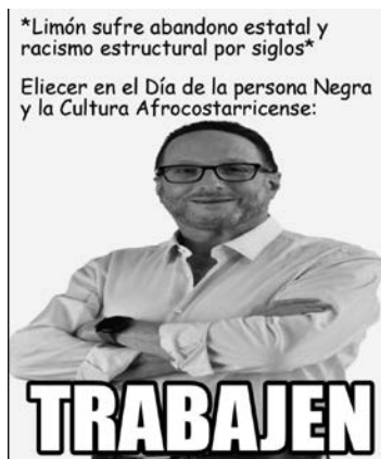
Figura 3. Actor

Nota: Captura de pantalla a partir del corpus de memes.