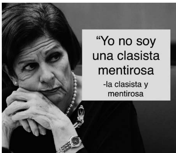
Figura 12. Estructura de frase célebre

En el caso de la estructura de frase célebre, esta contempla los memes que contienen una fotografía de alguna figura pública y una frase que se le atribuye a la persona con un propósito específico y que solo quienes poseen el conocimiento previo pueden descifrar la intención. En cuanto a la disposición de los elementos, la colocación de la imagen y el enunciado pueden variar. Un ejemplo se observa en la figura 12.