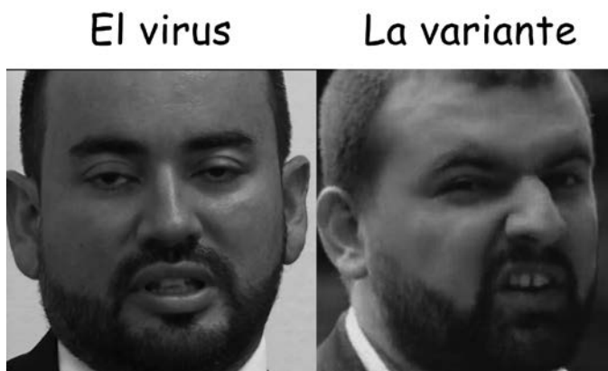
Figura 15. Estructura comparativa

En el caso de la estructura comparativa, se trata de los memes que confrontan dos o más recuadros que pueden ser opuestos o similares. Se encontraron quince de estas, dentro de las cuales se encuentra el meme de la figura 15.