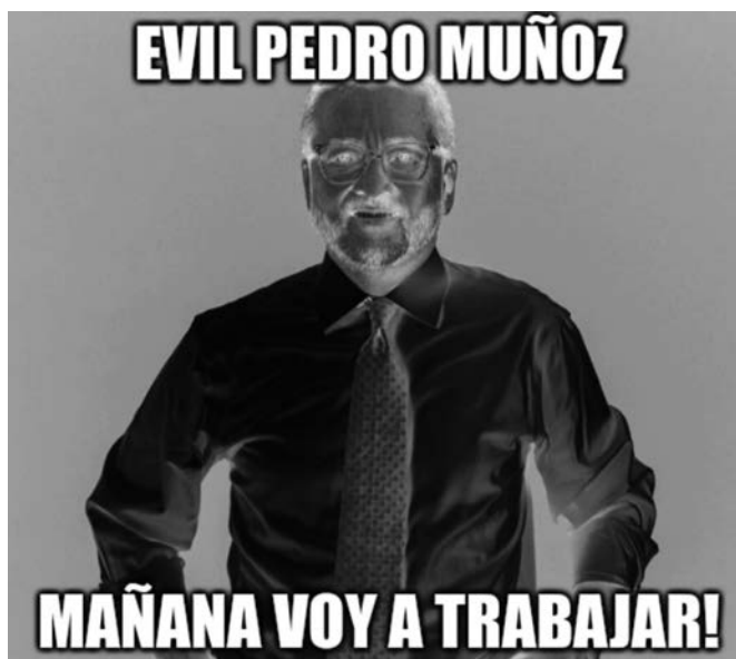
Figura 7. Meme con filtro 44

Nota: Captura de pantalla de un meme del corpus.