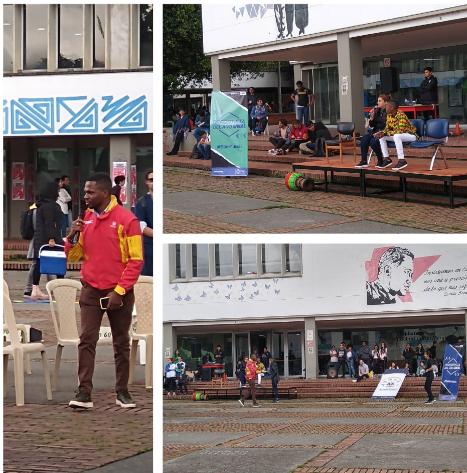
Figura 2 Performance sobre discriminación y racismo

Para concluir este emotivo evento, un equipo de recolección de información distribuyó un código QR a todos los presentes. Se solicitó amablemente a los participantes escanear ese código, utilizando sus dispositivos móviles, siendo redirigidos a un sencillo formulario con una única y significativa pregunta abierta. Esta pregunta solicitaba a los espectadores que expresaran, en una sola palabra, los sentimientos y emociones que habían experimentado a lo largo de la obra teatral. En la Figura 3, se pueden observar los sentimientos y emociones que los espectadores compartieron. El enojo emerge como el sentimiento más frecuentemente mencionado por la audiencia, seguido de cerca por la tristeza, la intriga y la empatía. Esta reveladora información resalta la profunda impresión que dejó la obra teatral en el público, mostrando cómo la narrativa