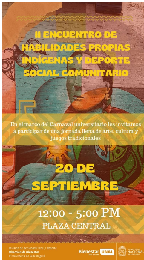
Figura 9 Segundo Encuentro de Habilidades Propias y Deporte Comunitario en la Universidad Nacional de Colombia, sede Bogotá