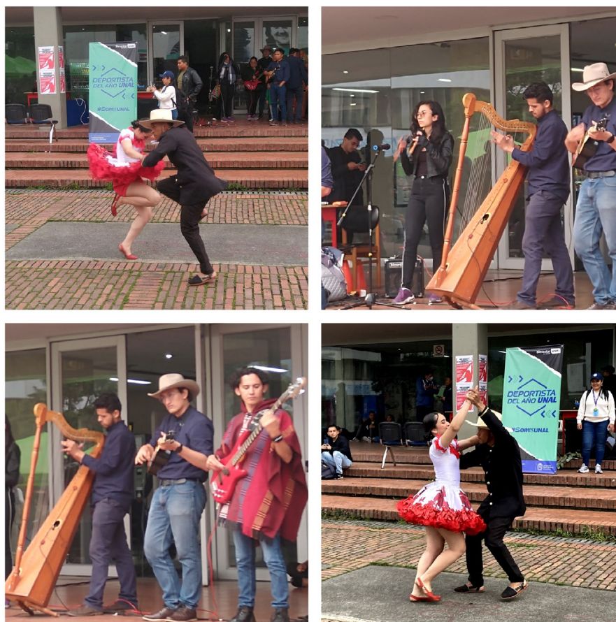
Figura 8 Muestra de folclore tradicional

Luego de este momento, los músicos que formaban parte del evento ofrecieron una exhibición de música llanera, destacándose especialmente las maracas, el cuatro llanero y el arpa en la creación de la melodía. Para culminar este espectáculo, dos talentosos cantantes provenientes de las comunidades llaneras cautivaron a la audiencia presente con sus voces melodiosas. Este punto culminante permitió que los asistentes se sumaran a las interpretaciones, formando un hermoso coro que resonó al ritmo de las emblemáticas canciones de la Región Orinoquía de Colombia.