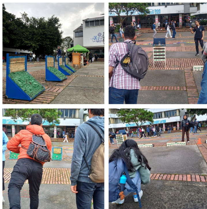
Figura 7 Muestra de juegos y deportes autóctonos