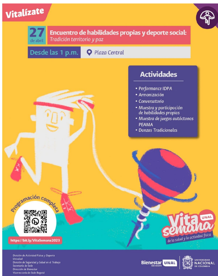
Figura 1 Primer Encuentro de Habilidades Propias y Deporte Comunitario en la Universidad Nacional de Colombia, sede Bogotá

Como se puede apreciar en la Figura 1, se seleccionaron seis actividades fundamentales para el evento, cada una de las cuales se alinea con tres objetivos específicos claramente definidos: (1) intercambiar experiencias acerca de los deportes tradicionales y habilidades propias, (2) dar a conocer los deportes tradicionales y habilidades propias a toda la comunidad universitaria y (3) gestionar espacios, dentro de la universidad, que permitan a toda la comunidad estudiantil participar de los deportes tradicionales y habilidades propias de los miembros del Cabildo Indígena. A continuación, se proporciona una descripción de las actividades desarrolladas en el evento.