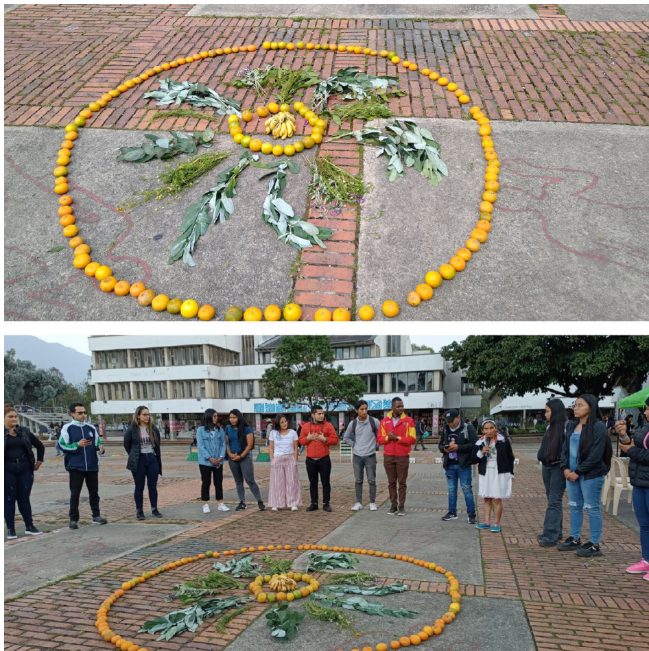
Figura 4 Armonización y mandala representativo de los pueblos indígenas

Por último, hizo un llamado a los espectadores para que reconocieran y respetaran las ricas y diversas tradiciones étnicas. En sus palabras, subrayó el valor del patrimonio cultural que representan y su significado para el país. Este emotivo momento fue un recordatorio de la importancia de preservar y honrar la diversidad cultural que enriquece nuestras vidas y nuestra nación. En la Figura 4, se presentan imágenes capturadas durante la armonización y el mandala.