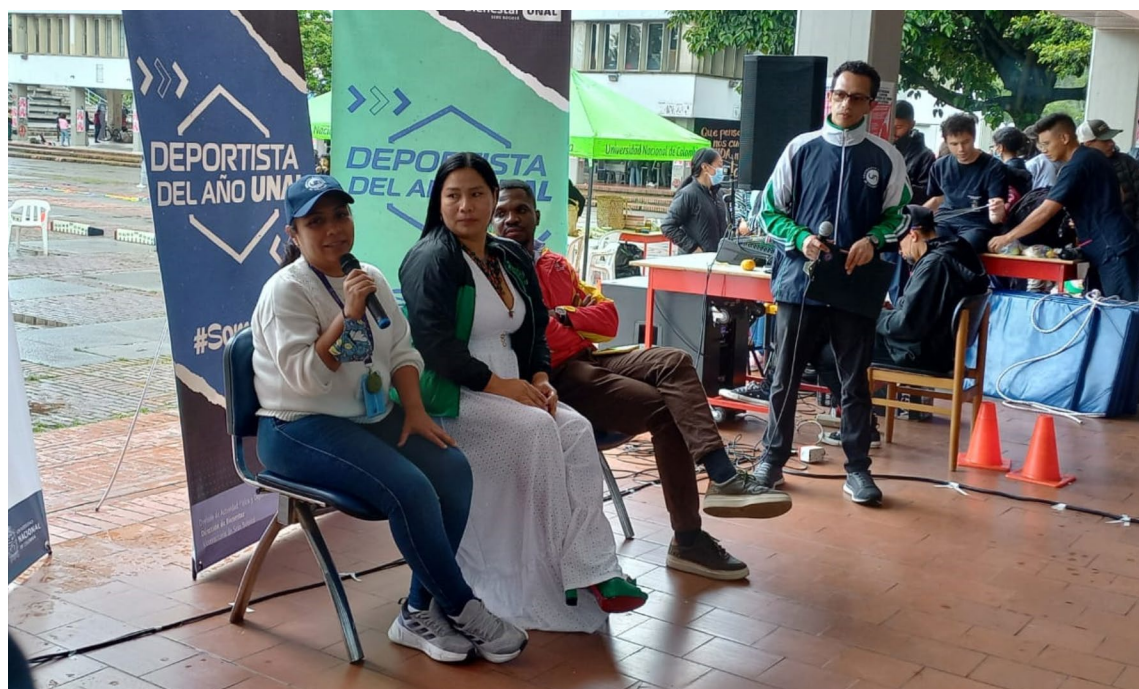
Figura 5 Conversatorio sobre Deporte Social Comunitario

La tercera actividad de este evento consistió en un enriquecedor conversatorio sobre el deporte social comunitario, como una valiosa herramienta para el reconocimiento étnico y cultural. En la Figura 5, se observa un registro visual de este evento. Durante este conversatorio, se contó con la participación de tres invitados destacados, quienes compartieron sus perspectivas, análisis y preocupaciones en torno a este tema crucial. Sus contribuciones proporcionaron una visión completa y enriquecedora sobre la interrelación del deporte, la comunidad y la identidad cultural. La Tabla 1, que se presenta a continuación, detalla cada una de las categorías que fueron rastreadas por los investigadores durante el conversatorio. Cada categoría se explica en función de las contribuciones y reflexiones de los invitados, lo que brinda una comprensión más profunda de los temas discutidos en el evento.