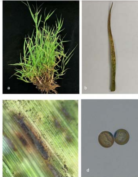
Figura 1 Síntomas y signos de Puccinia sp. en pasto estrella.

Nota. A. Síntomas en planta completa, B. Hoja con afectación severa, C. Uredinio en el envésde la hoja, D. Urediniosporas de Puccinia sp. Elaboración propia, 2023