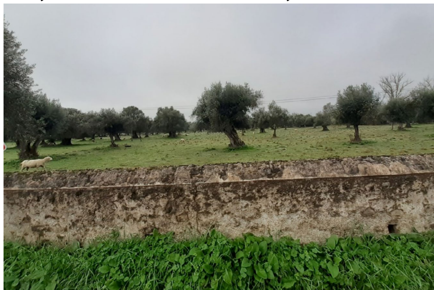
Figura 5 “Pastejo com olival tradicional no Alto Alentejo

Abaixo a imagem de uma pequena produção de carne de borrego e azeite em sistema de tradicional no Alto Alentejo. Trata-se de atividade complementar, uma vez que os proprietários são “agricultores de final de semana”. São professor e funcionária pública que nos finais de semana seguem para a atividade de “agricultores part-time ” em que a produção tem caráter complementar de renda e consumo doméstico.