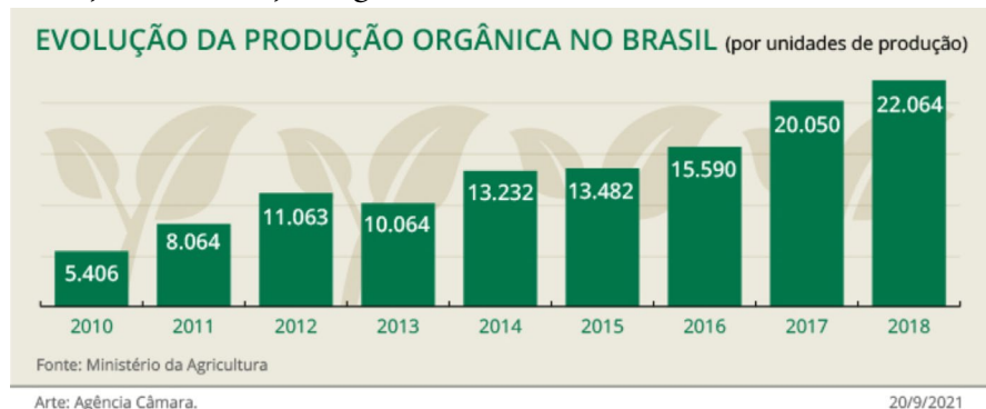
Figura 6 Evolução da Produção orgânica no Brasil