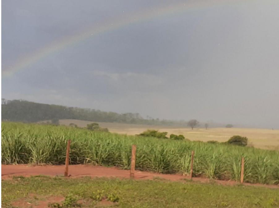
Figura 2 O “mix produtivo” do interior paulista