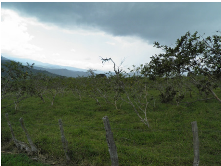
Figura 1 Plantación tradicional –silvestre- de guayaba. Vereda delicias (Puente Nacional Santander).

potencial productivo de la especie, es decir, la implementación de prácticas de manejo agronómico no son evidentes ni en el proceso de establecimiento ni en las labores de manejo integrado de cultivo, lo que ha favorecido niveles altos de incidencia y severidad de problemas fitosanitarios. Morales & Melgarejo (2010) afirman que en Colombia el cultivar se desarrolla principalmente en sistemas silvopastoriles en unidades de economía campesina con áreas inferiores a 2 hectáreas (figura 1).