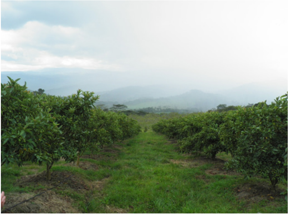
Figura 2 Plantación tecnificada con cultivo de guayaba. Vereda Delicias (Puente nacional Santander).