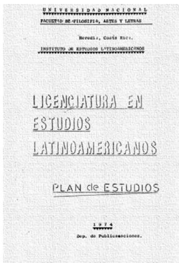
Programa 1974.

Otro espacio histórico de propiciación del pensamiento latinoamericano ha sido el posgrado en estudios latinoamericanos. Este ha sido desarrollado en momentos diferentes. En primera instancia, como resultado del impulso latinoamericanista que dio origen a la universidad, de manera que la Maestría en Estudios Latinoamericanos fue la primera de la UNA. En un segundo momento, a partir del 2000, cuando se efectúa un relanzamiento como Programa de Posgrado Maestría en Estudios Latinoamericanos (POSLATINO). Y, en una tercera fase, se perfila, con diferentes reformulaciones, el proceso amplio que define a la MELA tal cual se encuentra en la actualidad.