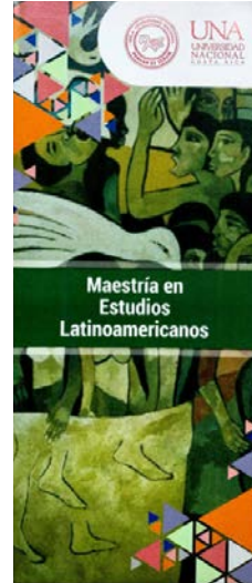
Programa 2022.

El programa más reciente, por su parte, se encuentra compuesto de cuatro ciclos de un semestre cada uno, de modo que el proceso formativo se desarrolla desde un tiempo aproximado de dos años en total. Los primeros tres semestres se componen de cuatro diferentes cursos, mientras que el final consta de tres cursos.