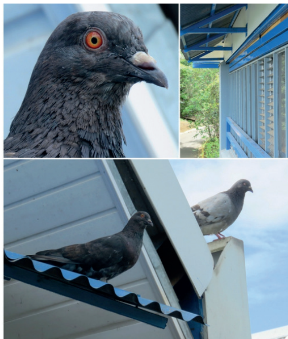
Figura 5. Infraestructura y cavidades de uso potencial para las palomas de Castilla en la Universidad Nacional, Heredia, Costa Rica. 2015.

Es importante llamar la atención sobre la necesidad de que exista una coordinación con mantenimiento de la Universidad, para que dé soporte inmediato para reparar huecos en los techados o remover los sitios potenciales, donde se observe la presencia de las palomas de Castilla, y no confundir otras poblaciones existentes en los edificios que no causan molestia (búhos, y otras especies de aves).