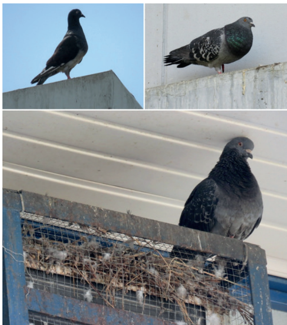
Figura 4. Sitios potenciales para percha y anidación de la paloma de Castilla en la Universidad Nacional, Heredia, Costa Rica. 2015.