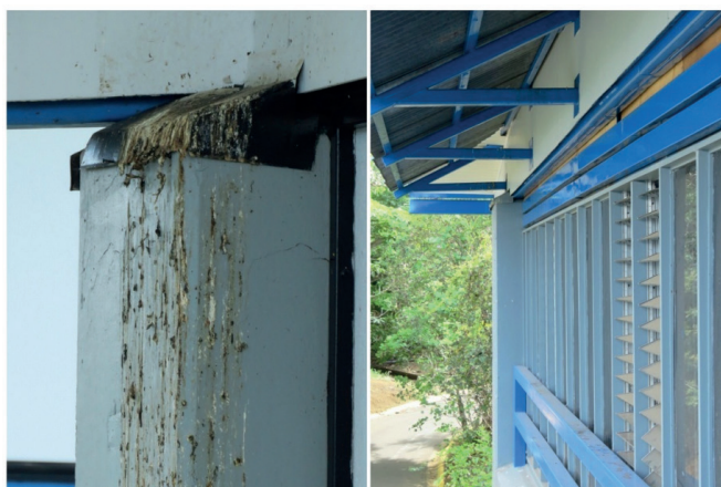
Figura 3. Acumulación de excretas de la Paloma de Castilla en la Universidad Nacional, Heredia, Costa Rica, 2015.

Es importante entender que estas poblaciones de palomas son muy dinámicas, por lo que es de esperar que algunos individuos se puedan trasladar a otros edificios en donde encuentren las condiciones idóneas para establecerse (sitios de percha, establecimientos planos con sombra para colocar los nidos, huecos en los techados entre otras. Asimismo, Barlow, Kean y Briggs, (1997) menciona que el sacrificio en especies monógamas con una alta tasa de mortalidad y productividad, como lo son las palomas de Castilla, no es un método efectivo para el control de las poblaciones, además, ese tipo de métodos no es bien aceptado por la ciudadanía, lo que podría provocar un aumento en los problemas de carácter ético.